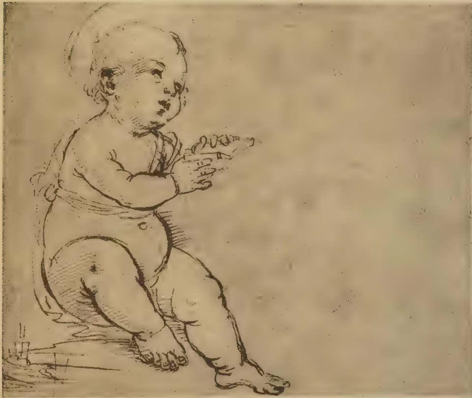
Etude pour l'Enfant, au dos de la précédente esquisse